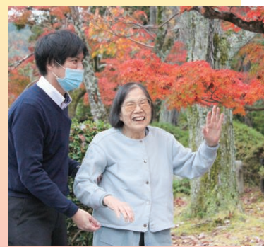
久しぶりの外出レクレーションで真如堂へ行きました。美しい紅葉や建物にうっとりされていました。